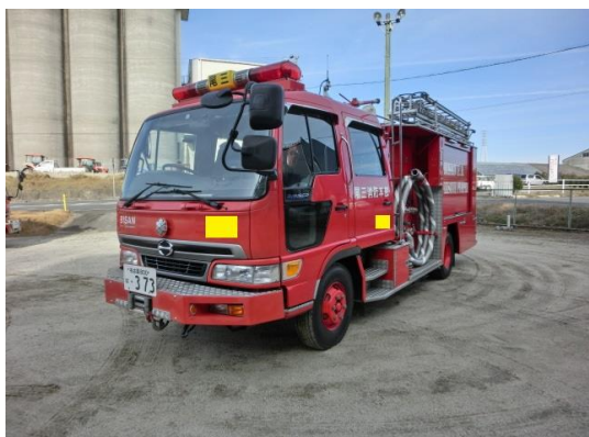
水槽付消防ポンプ自動車②