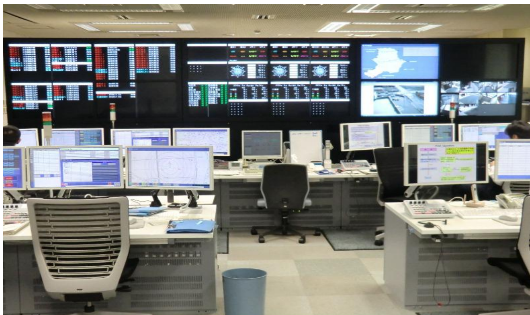
尾三消防組合・豊明市・長久手市消防指令センター

住 所：愛知県愛知郡東郷町大字諸輪字曙18番地 電 話：0561(38)5119 F A X：0561(38)4119 庁 舎：尾三消防本部庁舎内