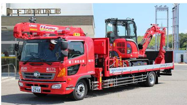
H25.3.7総務省消防庁から無償配備