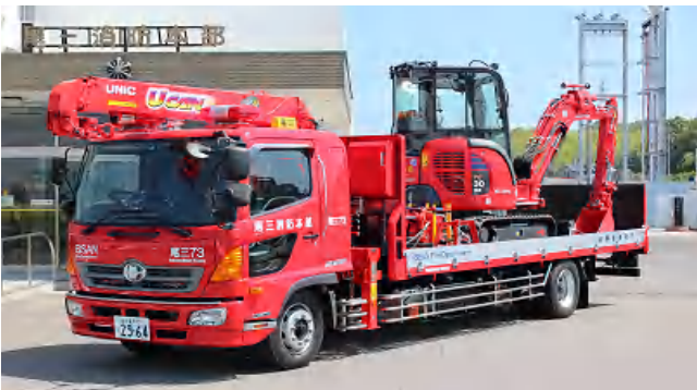
H25.3.7総務省消防庁から無償配備