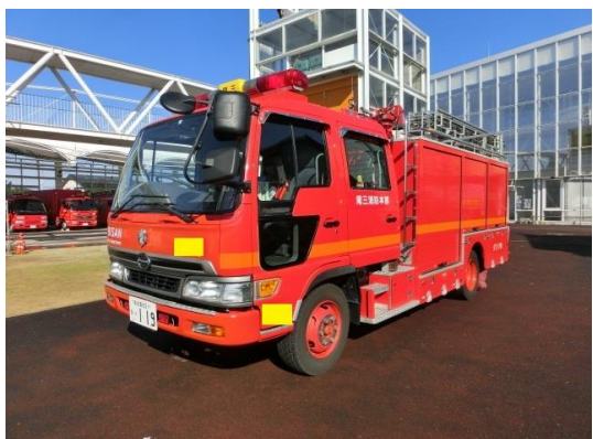
水槽付消防ポンプ自動車①