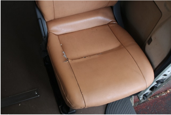
後部席 シート破れあり