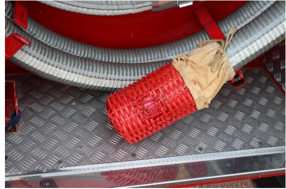
右側 ちりよけカゴ修繕あり