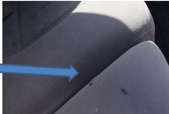
後部席の破れ、シミ