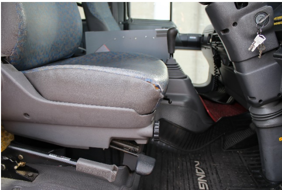
運転席 シート破れあり