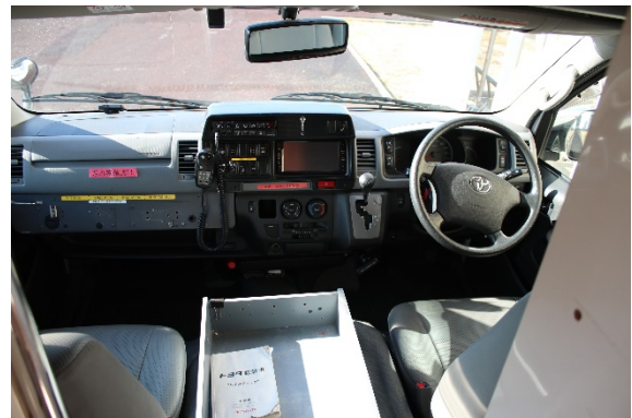
ステアリング及び運転席、助手席