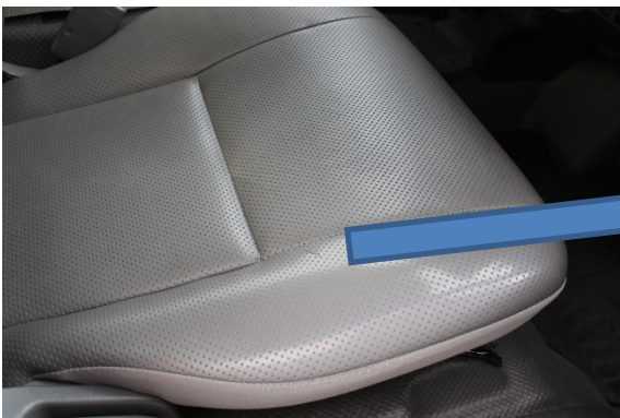
運転席 シート破れあり