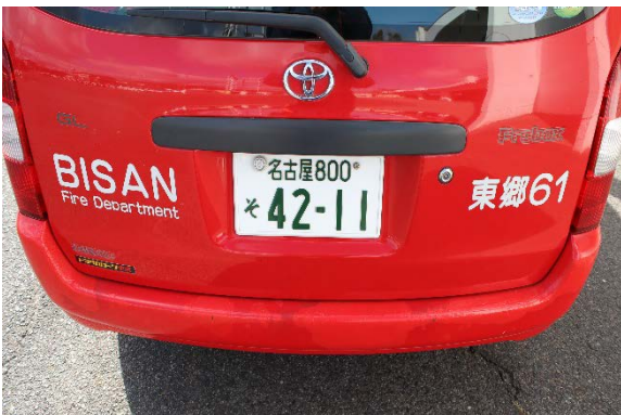
リアバンパー 塗装の修繕あり