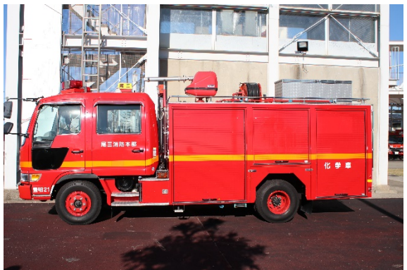
左側面シャッター開放