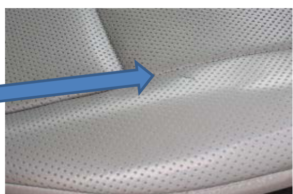
運転席シート破れ