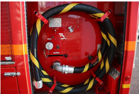
左側 吸管ストレーナー等なし