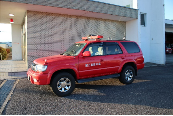
ハイラックスサーフ