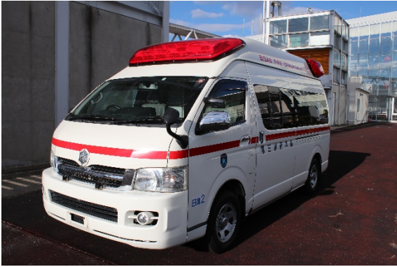
高規格救急自動車②