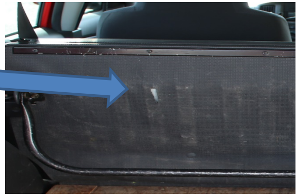
後部席後ろ側 破れ、擦れあり