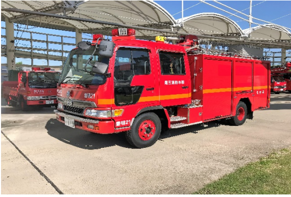
日野 消防化学自動車