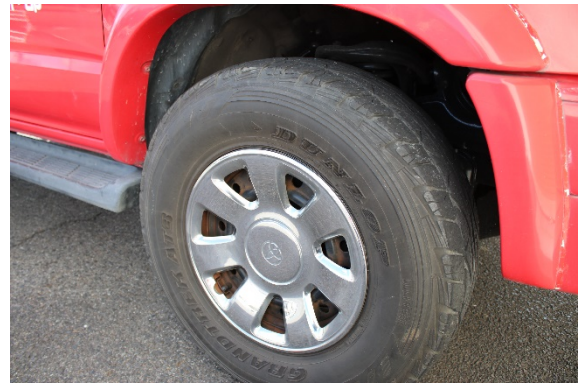
ホイールキャップ