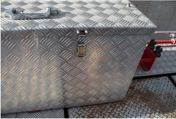
上部 ボックス金具部分破損