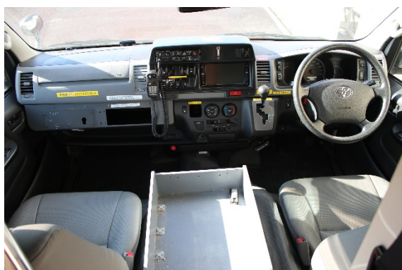
ステアリング及び運転席、助手席