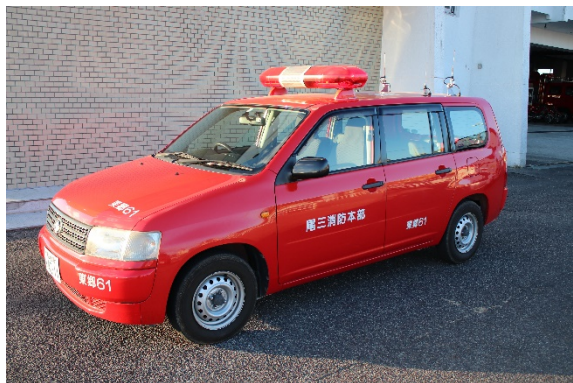
トヨタ プロボックス