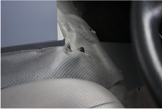
コンソールボックス付近破れあり