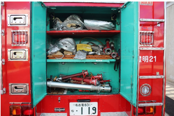
背面シャッター開放