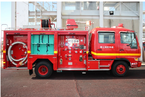
右側面シャッター開放