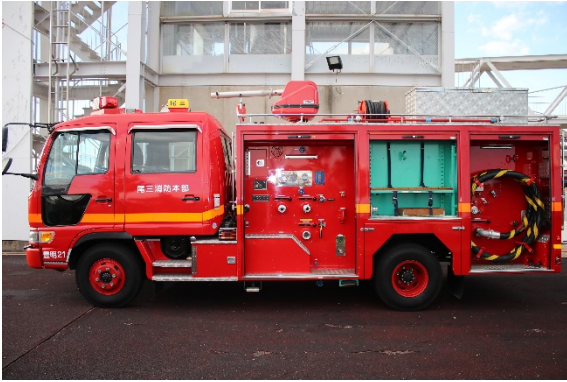
左側面シャッター開放