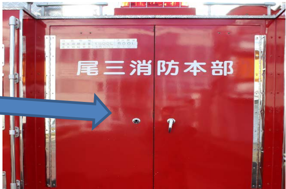
背面 キーハンドル無し