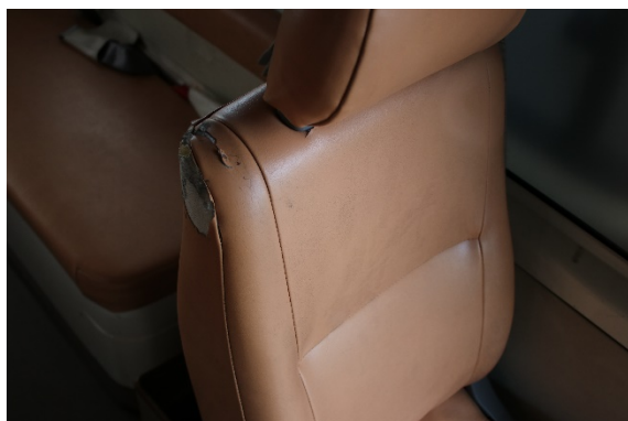
後部席 シート破れあり