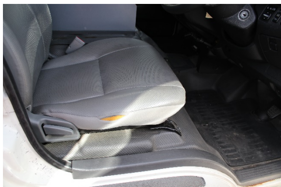
運転席 シート破れあり