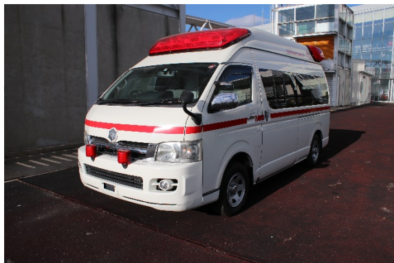
トヨタ 高規格救急自動車①