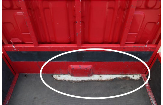
荷台ゴムシート部に破れあり