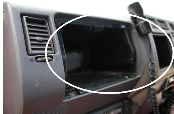
助手席側 グローブボックス 中央センタークラスター