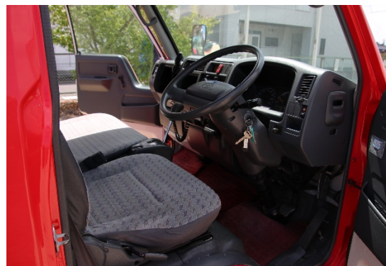
運転席、ステアリング状況