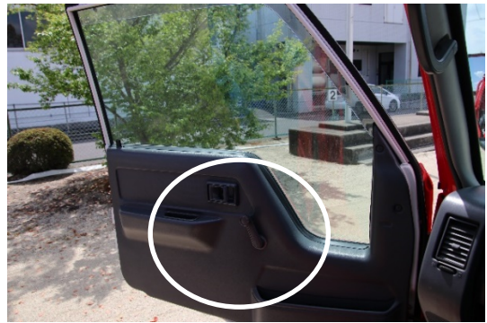
窓の開閉は手動式