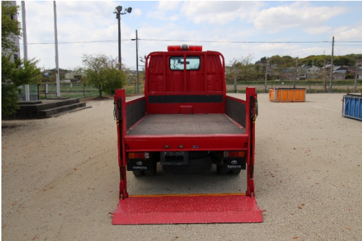
荷台状況、パワーゲート