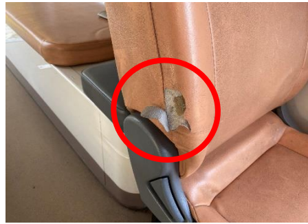
後部席 シート破れあり