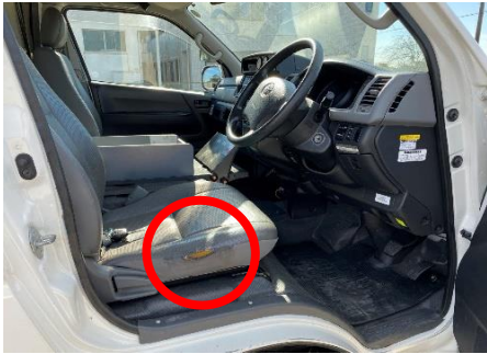
運転席 シート破れあり