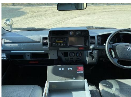
ステアリング、運転席及び助手席