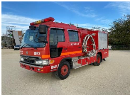
日野 水槽付き消防ポンプ自動車