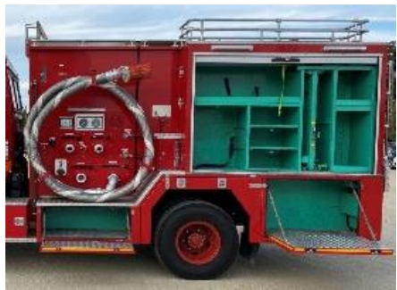
左面後部シャッター開放