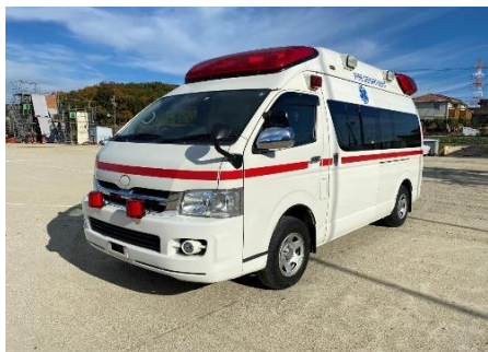
トヨタ 高規格救急車①