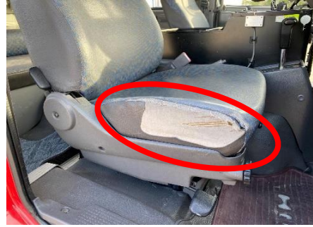
運転席 シート破れ