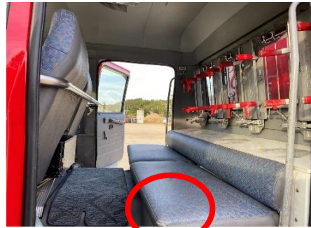
後部席 シート破れ