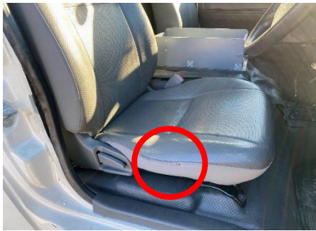
運転席 シート補修あり