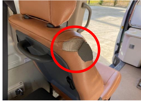
後部席 シート破れあり