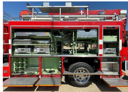
左面後部シャッター開放