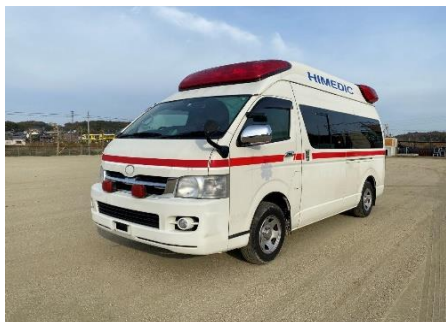
トヨタ 高規格救急車②