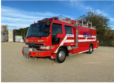
日野 救助工作自動車