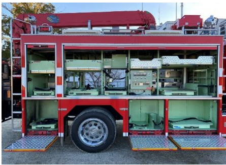
右面後部シャッター開放