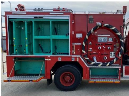
右面後部シャッター開放