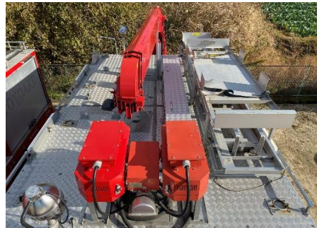
上部 車両照明電球なし