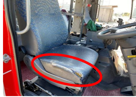
運転席 シート破れ