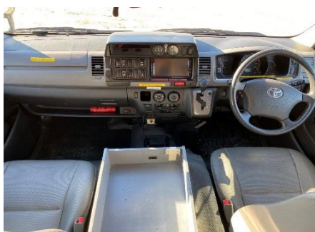
ステアリング、運転席及び助手席