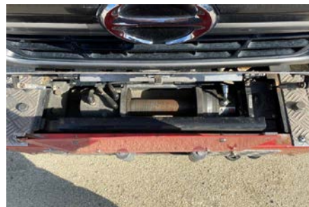
フロントウインチ故障