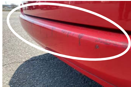
リアバンパー 塗装の剥がれ修繕あり