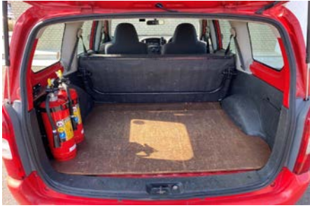
トランクルーム 荷台マットなし