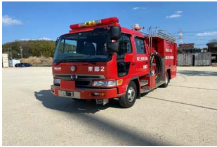
日野 水槽付き消防ポンプ自動車