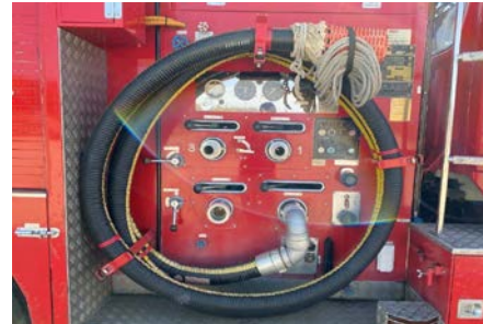
右面ポンプまわり