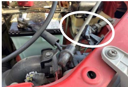
エンジンルーム内のクリップ破損あり