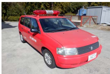
トヨタ 事務連絡車