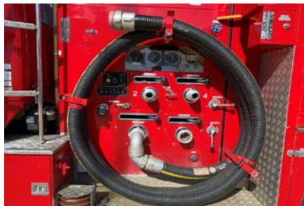
左面ポンプまわり