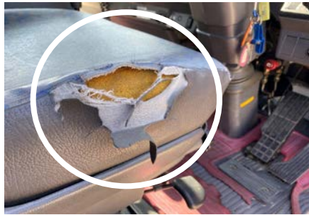
運転席 シート破れ