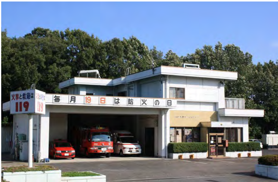
みよし消防署南出張所

住 所：愛知県日進市浅田町西浦15番地 電 話：052(809)0119 F A X：052(808)3028 庁 舎：558.00 m 2