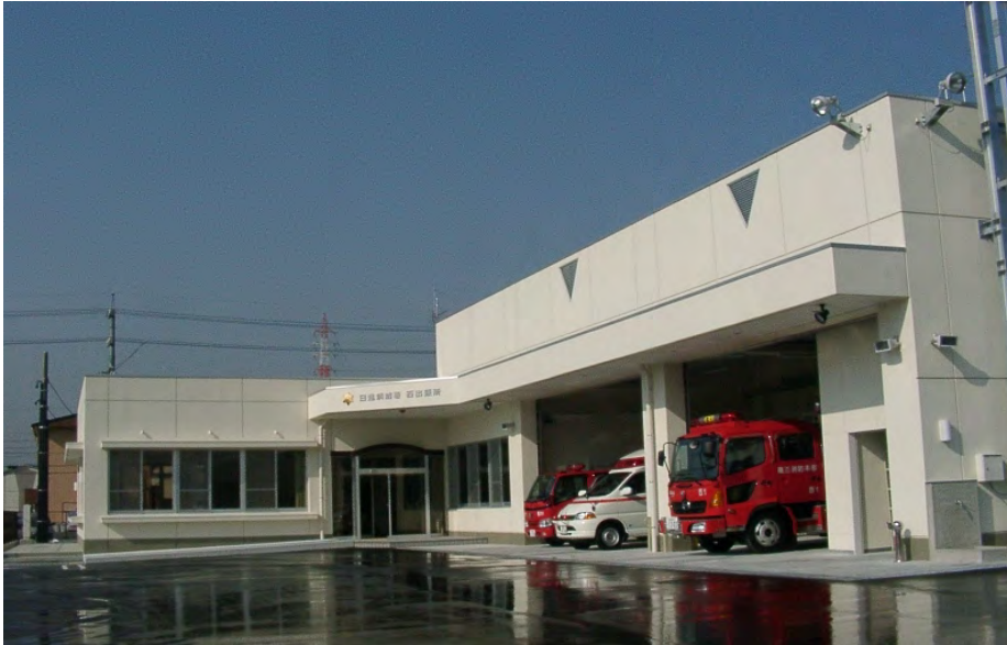
日進消防署西出張所

住 所：愛知県日進市浅田町西浦15番地 電 話：052(809)0119 F A X：052(808)3028 庁 舎：558.00 m 2