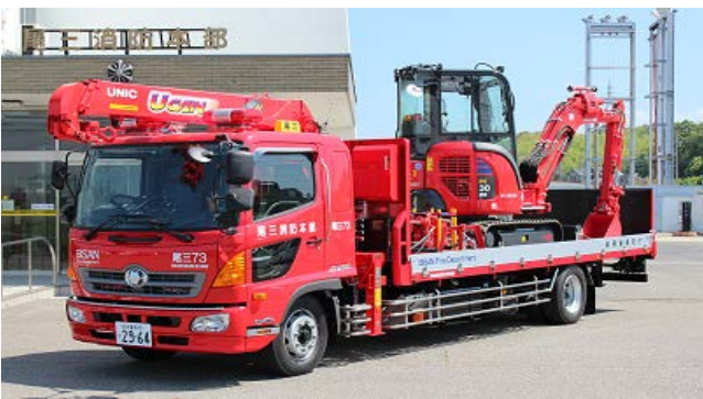
H25.3.7総務省消防庁から無償配備