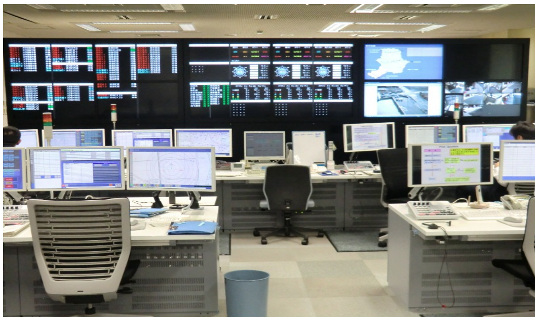
尾三消防組合・豊明市・長久手市消防指令センター

住 所：愛知県愛知郡東郷町大字諸輪字曙18番地 電 話：0561(38)5119 F A X：0561(38)4119 庁 舎：尾三消防本部庁舎内